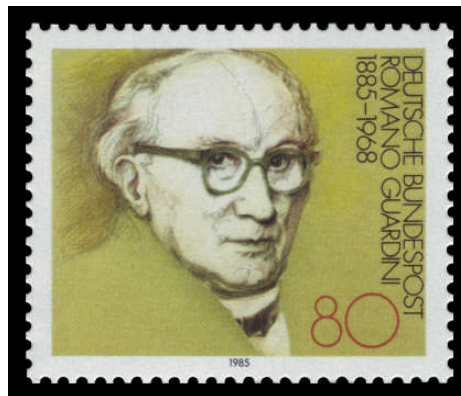
Bild: Briefmarke aus dem Jahr 1985 mit Romano Guardini