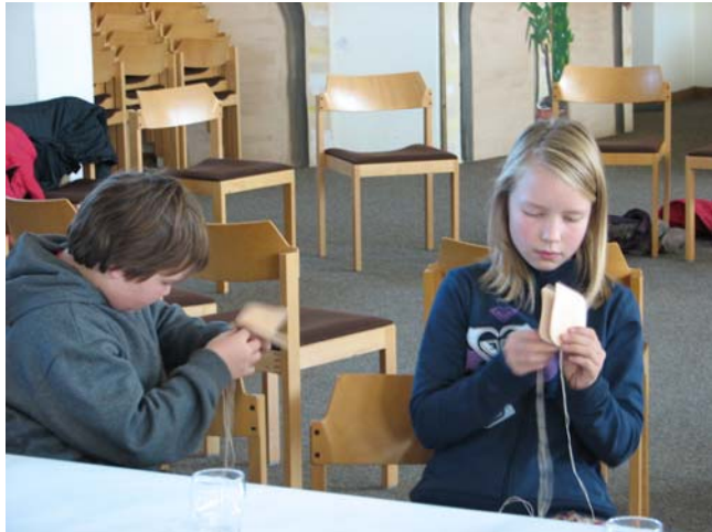
Bild: auch gebastelt wird bei der Kinderbibelwoche, wie hier im Herbst 2008 im Paul-Gerhardt-Saal

Die nächste KiBiWo zum Thema „ Abenteurer mit Onesimus “ findet am Wochenende 13. bis 15. März 2009 statt, näheres im März-Gemeindebrief!