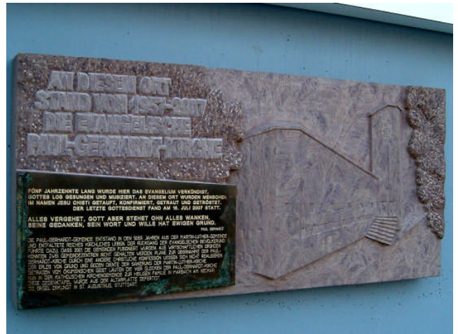
Bild: Die neue Gedenkplatte für die Paul-Gerhardt-Kirche an der Ecke Warndtstraße / Neunkirchenweg

Stein ist ein Symbol für Unvergänglichkeit, für das, was bleibt - auch in der Bibel. Jakob richtet ein Steinmal auf und begründet damit das Heiligtum von Bethel. Die Zehn Gebote sind in Steintafeln eingraviert. Jesus spricht vom klugen Mann, der sein Haus auf Fels baut.