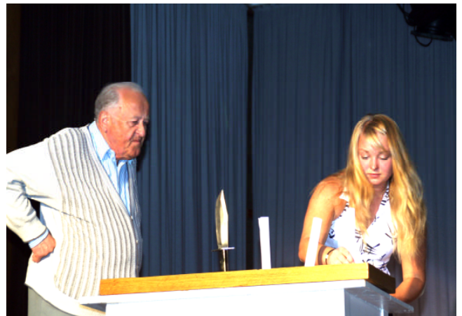
Bild: einer der ältesten Überraschungsgäste beim letzten Galaabend in der MLK mit einer jugendlichen Sketchpartnerin

Am Samstag, 09. Oktober findet im Paul-Gerhardt-Saal der Martin-Luther-Kirche Ulm ab 19.30 Uhr der 21. Gala-Abend der Nachwuchskünstler aus der Region Ulm/Neu-Ulm statt.