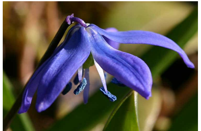
Bild: Der Blaustern, lat. Scilla, überwuchert die Wiesen rund um die Martin-Luther-Kirche so sehr, dass die Kirche im Frühjahr regelmäßig für zwei Wochen von einem intensivblauen Meer buchstäblich umwogt wird. Das Grün der Wiese wird vom Blau dieser Blumen in diesen Tagen völlig überlagert.

Im Herbst bleiben allerhand Beeren übrig, dann waren auch schon Seidenschwänze Gäste. Wenn im Winter in den Parkbaumkronen die Saatkrähen in Scharen pausieren, hüpfen unten Zeisig, Schwanzmeise, Hänfling herum und schauen, was es am Kompost oder an den Futterstellen noch gibt.