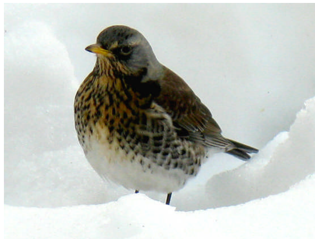
Bild: eine Wacholderdrossel mit ihrem gefleckten Brustkleid

Die MaLuKi eine Oase? - Manche empfinden das so: da kommen Pilger vorbei und finden eine offene Tür, da sitzt ab und an jemand drinnen und braucht an einem der verkehrsreichsten Plätze Ulms, eine Oase der Ruhe und Besinnung. Staubig und laut ist es um die Kirche herum und trotzdem ist das Ensemble, auch noch in anderer Hinsicht, eine kleine Oase. Ringsherum gibt es Nischen und Refugien, die von Fauna und Flora genutzt werden. Die Brennnessel wird nur leicht zurückgedrängt, wenn sie den „Tränenden Herzen“ und dem „Frauenmantel“ zu sehr auf Blätter rücken. Unter der einst wild aufgegangenen Eibe wächst zuverlässig die vielblütige Weißwurz, etwas weiter die Knoblauchrauke und in der Ecke, wo man gelegentlich auf einen Geo-Catcher trifft, gedeiht die Felsenbirne. Hier auf der Nordseite brüten neben der Amsel auch der Haus-Rotschwanz und der quirlige Fliegenschnäpper.