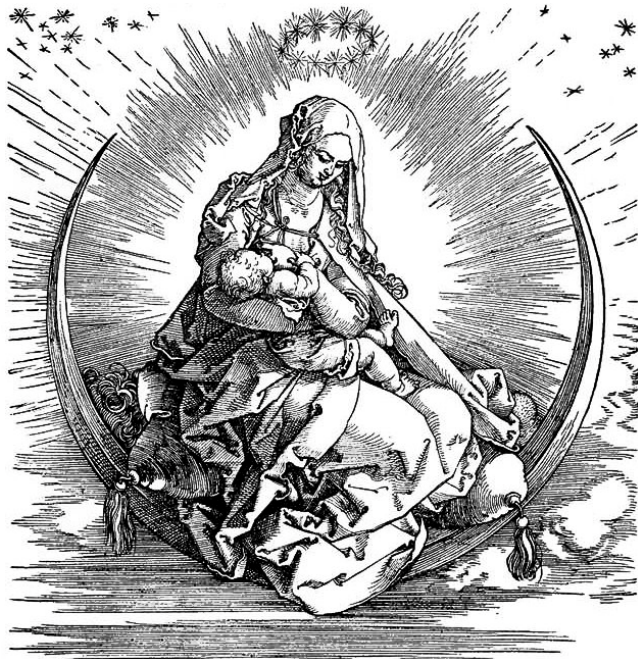
Bild: Stern und der Mond mit seiner Sichel trägt die apokalyptische Frau mit dem Kind – Holzschnitt von Albrecht Dürer