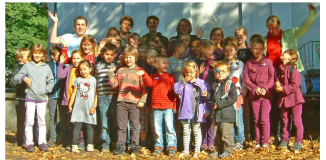
Bild: Neue Kinderkirche mit Mitarbeitern auf dem Kirchplatz.

Wie das geht? Machbar ist gar nichts. Doch viel geschieht „von selbst“ im unbeschwerteren Spiel, im fröhlichen Singen und Musizieren, im Beten, im Hören der biblischen Geschichten. Viel überträgt sich durch Erwachsene und Jugendliche, die Kinder ehrenamtlich in die Mitte stellen, etwas von ihrer Zeit schenken, von ihrem Glauben und ihrer Liebe.